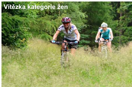
Vítězka kategorie žen