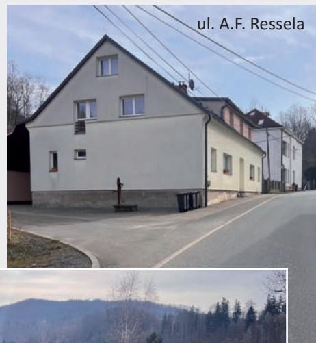
ul. A.F. Ressela