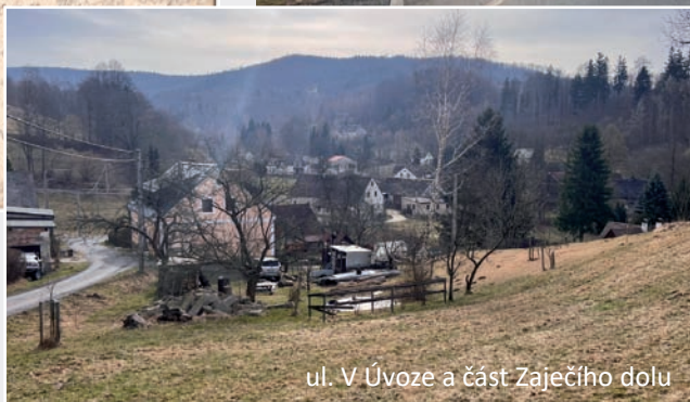
ul. V Úvoze a část Zaječího dolu