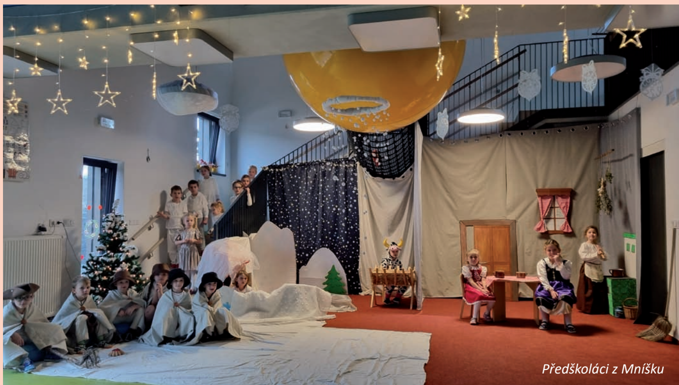
Předškoláci z Mníšku